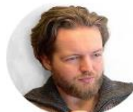
AI Andy @AIAndyYT